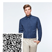
AIFOS L/S CM5504