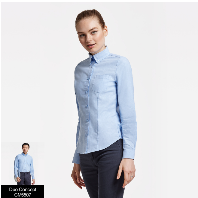
Duo Concept CM5507