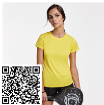
MONTECARLO WOMAN CA0423