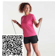
IMOLA WOMAN CA0428